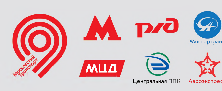
СХЕМА СКОРОСТНОГО ОБЩЕСТВЕННОГО ТРАНСПОРТА МОСКВЫ

Московский метрополитен МЦК МЦД Автобусы-экспрессы Пригородные поезда Аэроэкспресс